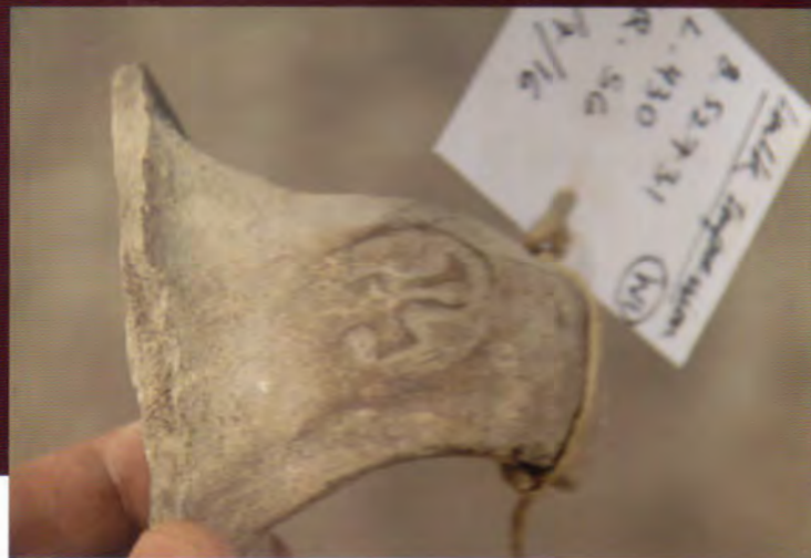
L 1 melech (otisk pečeti).