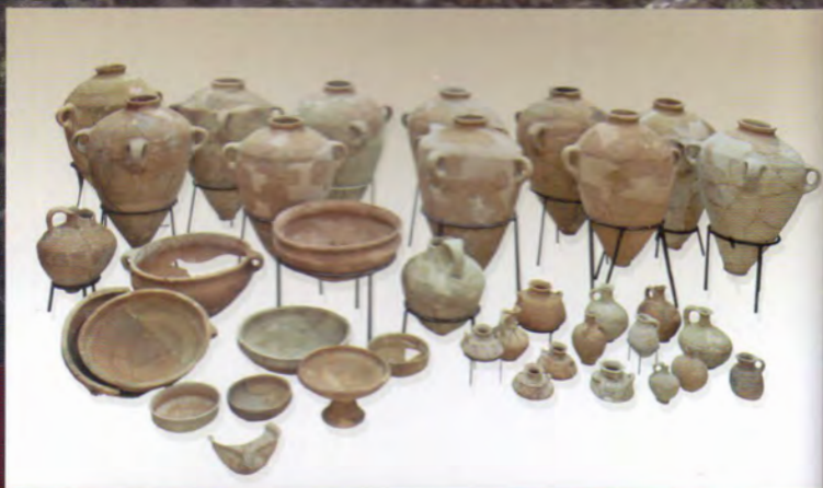
Keramika z mladší doby bronzové.