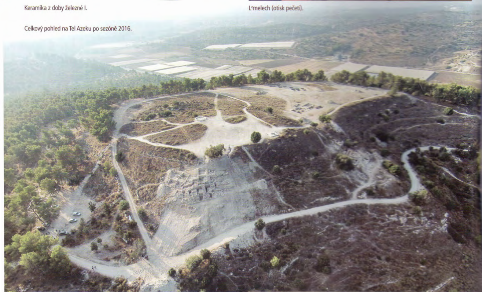
Celkový pohled na Tel Azeku po sezóně 2016.