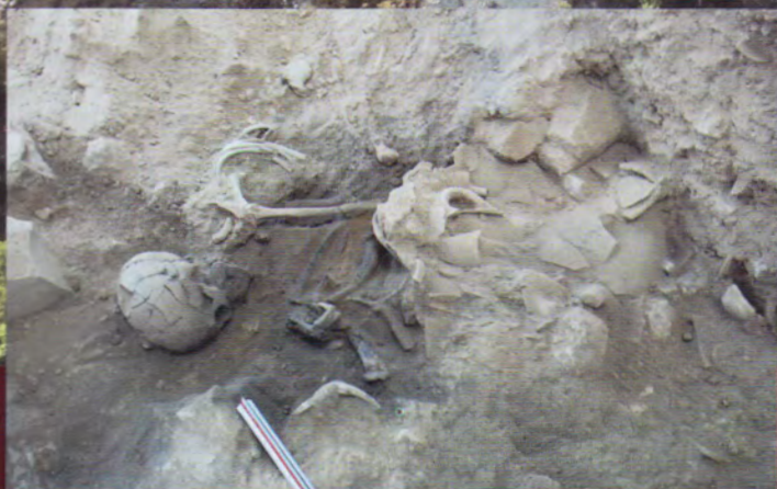
Doklad destrukce z mladší doby bronzové.