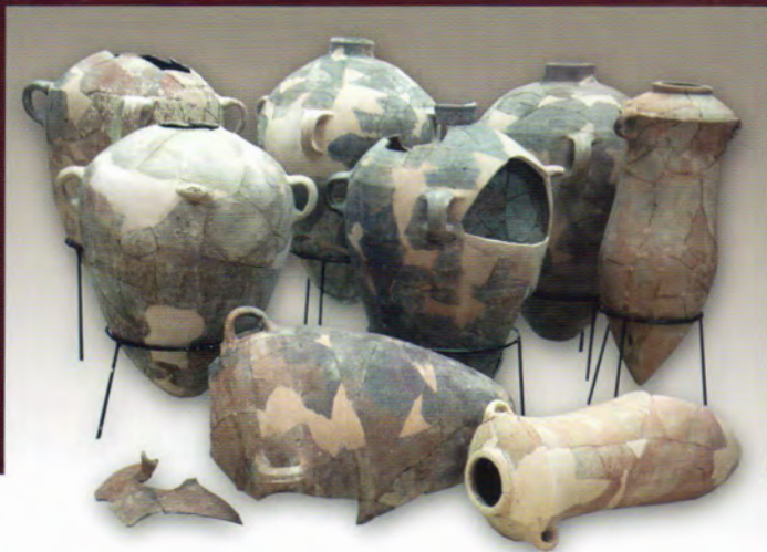
Keramika z doby železné I.